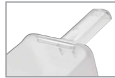
FG9F7600CLR *Trabaja con el sistema de almacenaje de ingredientes.