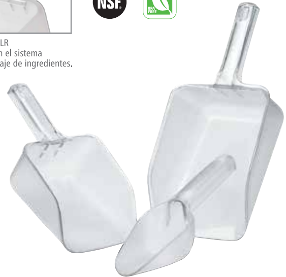
FG288200 FG288200 FG288600