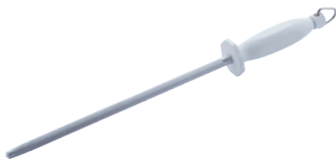
1 Chaira institucional 12" Ref. I90909 Ean 13: 7703142909097