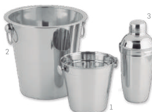
1 Hielera Nova Ref. I44459 Ean 13: 7703142444598