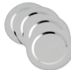
1 Portavasos redondo x 4 Ref. I44441 Ean 13: 7703142444413