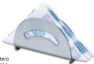
1 Servilletero Ref. I44414 Ean 13: 7703142444147