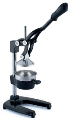
1 Exprimidor Ref. I83660 Ean 13: 7703142836607