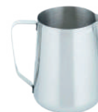
1 Jarra acero inox 1 L Ref. I90201 Ean 13: 7703142902012