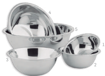
1 Bowl 16 cm Ref. I44457 Ean 13: 7703142444574