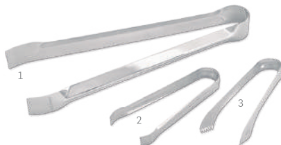
1 Pinza 14" Incainox 36 cm Ref. I40102 Ean 13: 7703142401027