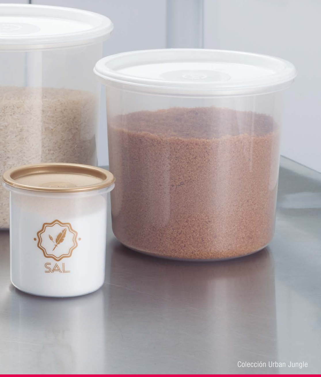
Colección Urban Jungle

En ESTRA brindamos soluciones plásticas de diferentes colores y diseños. La estética, la durabilidad y calidad de nuestros productos permiten mantener una cocina más dinámica, llamativa y ordenada. Granos, frutas, verduras y cárnicos son algunos de los alimentos que se pueden almacenar en cualquiera de nuestros recipientes multiusos presentes en varias formas; rectangulares, redondos, cuadrados y de muchos colores para que en los hogares siempre haya un equilibrio entre lo estético y lo práctico, permitiendo diferenciar su contenido de tal manera que harán de la cocina un sitio más atractivo y ordenado.