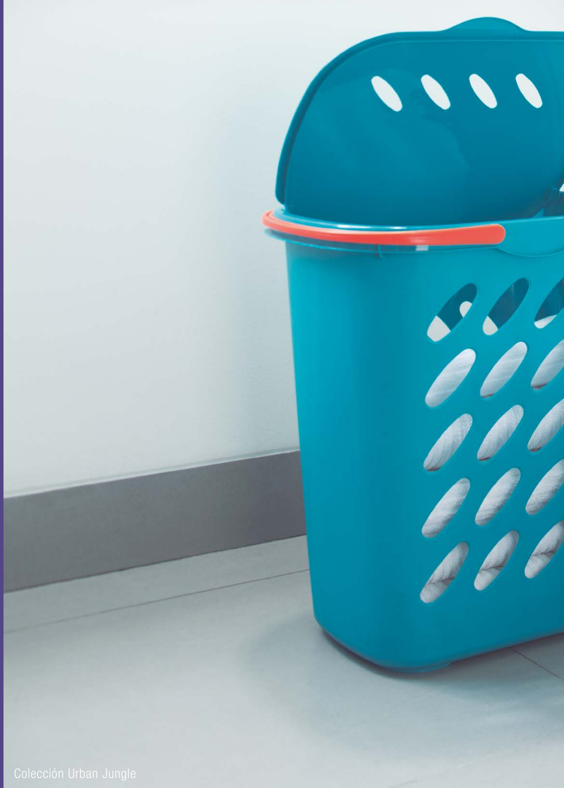
Colección Urban Jungle