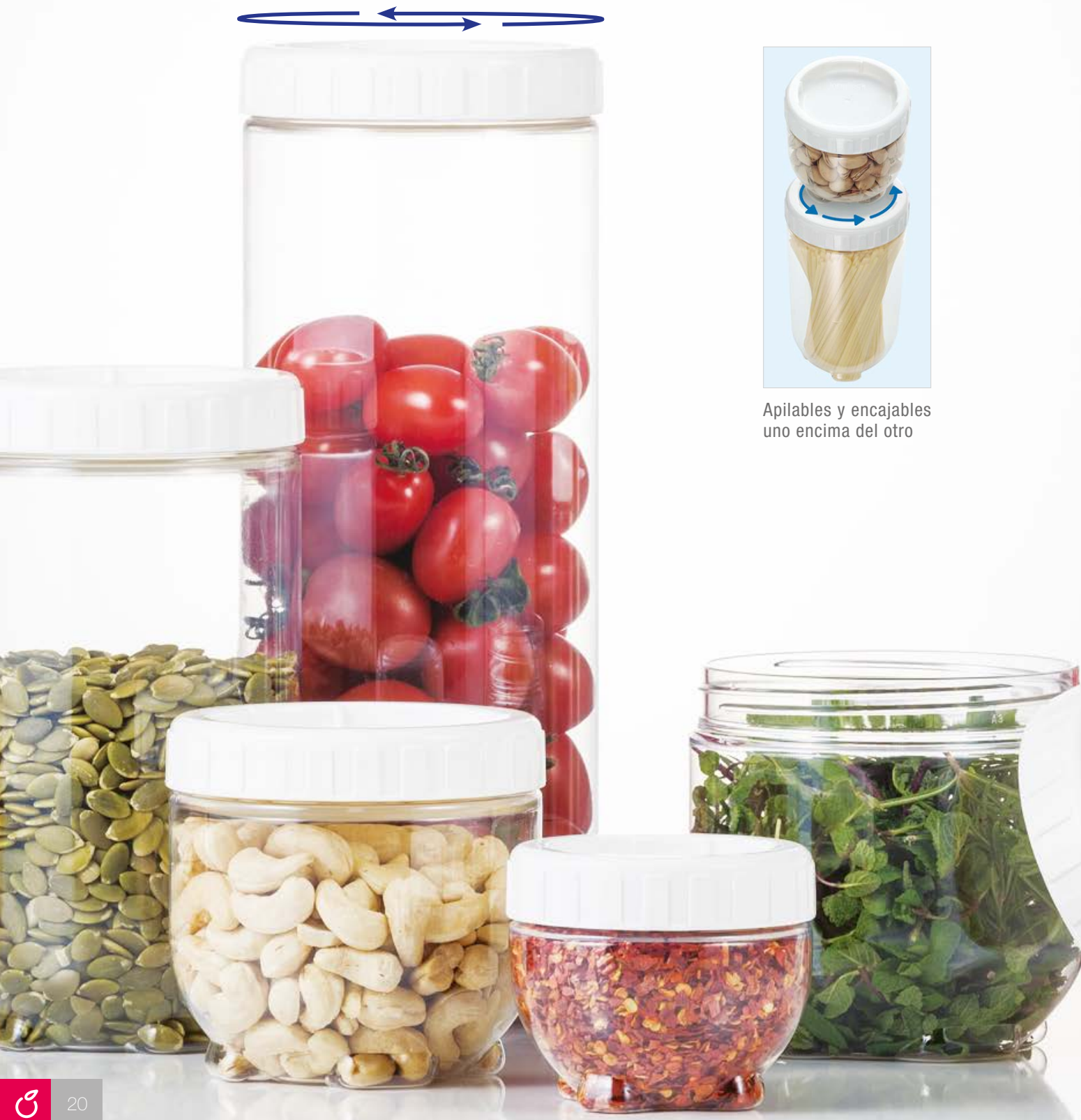
Apilables y encajables uno encima del otro